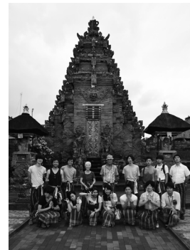
2013年秋 バリ島へのゼミ旅行

1981年4月に講師として本学に着任して以来、33年間、個性的な先生方や若く元気で優しい学生達に囲まれて楽しい時間を過ごすことが出来ました。長い間、ありがとうございました。