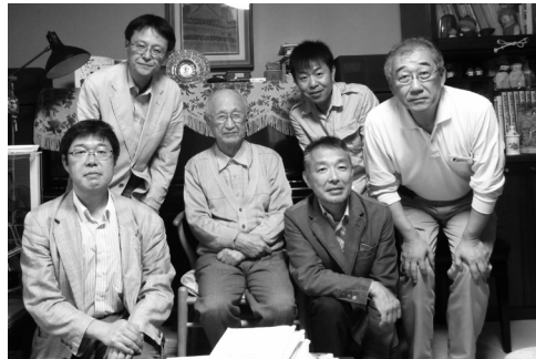
先生ご自宅の書斎にて

ふり返れば当研究室は、昭和51年（1976）から平成7年（1995）までの20年間に、280有余人の有為な人材を輩出しました。それからはや18年が経過し今や諸君も還暦（60才）から不惑（40才）の年齢に達し、それぞれの立場で大いに活躍されて立派に業績を