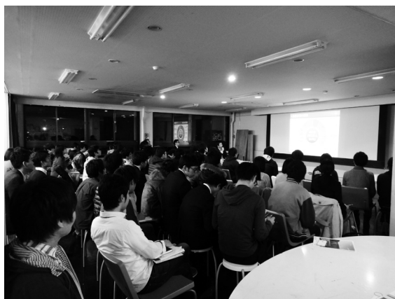
数多くの学生らが集まった講演風景