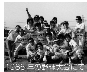
1986年の野球大会にて

4年生になって初見研に入ると、他大学との交流が増え生活が一変した。大学周辺でもよく飲んだが、東京での研究会や見学会の後でも飲んだ。また、東大・芝浦工大と定期的に草野球の試合もおこなっていた。ちゃんとユニフォームまであった