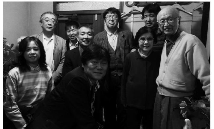
先生ご自宅の玄関にて